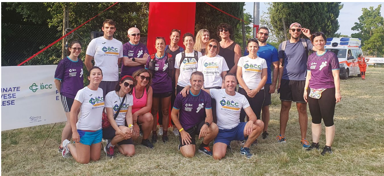
Martedì 27 giugno si è tenuta la 6ª edizione della "Dall'Olmattello ai Calanchi", organizzata dall'Atletica 85 Faenza della quale il nostro istituto è sponsor istituzionale, i cui proventi di oltre 4.000 euro saranno devoluti a favore delle popolazioni colpite dall'alluvione. Alla manifestazione, che prevedeva una passeggiata o una corsa su due percorsi alternativi nelle prime colline faentine con un ristoro finale consumato nell'area parrocchiale di Castel Raniero, hanno partecipato circa 800 persone di cui circa 40 colleghi BCC, a conferma della vicinanza della nostra banca alle iniziative del territorio, soprattutto a quelle con finalità benefiche come in questa occasione

A fronte di eventi straordinari, occorre agire con contromisure straordinarie. Questo principio, elementare ed ovvio nell'enunciazione, comporta per LA BCC ravennate, forlivese e imolese l'esigenza di intervenire con celerità, con snellezza di procedure, con tutti gli strumenti di cui possono necessitare i nostri Soci e clienti, per minimizzare i disagi, in alcuni casi enormi, che stanno affrontando.