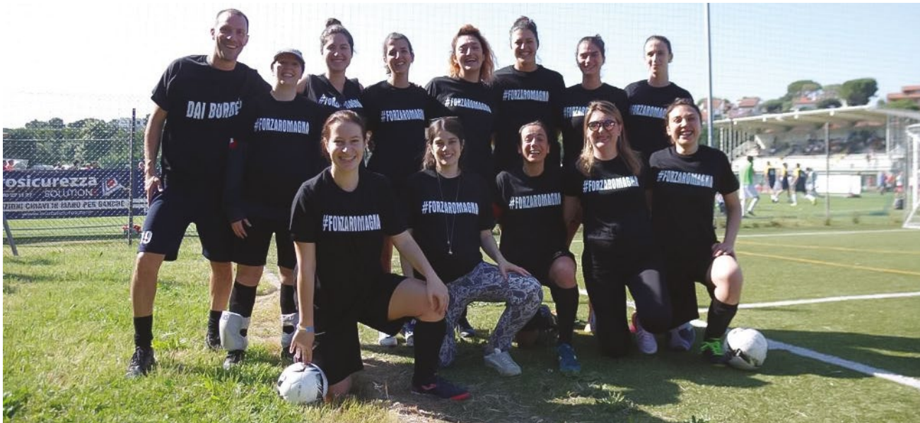
La squadra di calcetto della BCC con l'hashtag #FORZAROMAGNA

Moltiplichiamo gli interventi di natura straordinaria, perché i danni sono enormi e i tempi della macchina pubblica degli aiuti, fondamentale e insostituibile, sono necessariamente più lunghi