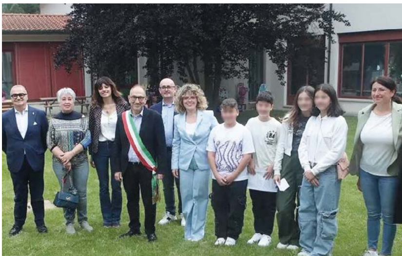
Inaugurazione del “Giardino di Oriano”, spazio outdoor all'interno della Scuola Primaria “Bizzi”

Sabato 25 maggio l'Istituto Comprensivo 7 di Imola ha potuto inaugurare lo spazio outdoor interno al plesso di Scuola Primaria “Bizzi”, frutto dell'impegno di tutta la comunità scolastica, dell'investimento di fondi PON dedicati e del generoso contributo dell'Associazione genitori “B.Bizzi”, della BCC ravennate, forlivese e imolese e della gelateria Burrocacao, tutti presenti all'inaugurazione.