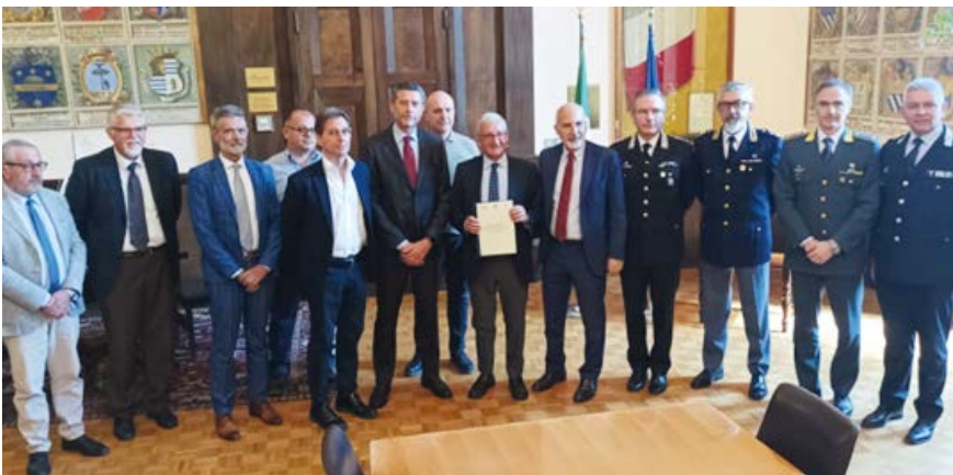
I rappresentanti degli Istituti di Credito insieme ai vertici delle Forze dell'Ordine e della Polizia di Ravenna presenti alla firma del Protocollo in Prefettura

Altro impegno assunto dalle banche è di dotare ciascuna dipendenza di specifiche misure di sicurezza finalizzate ad innalzare il livello di protezione dei propri impianti e agenzie.