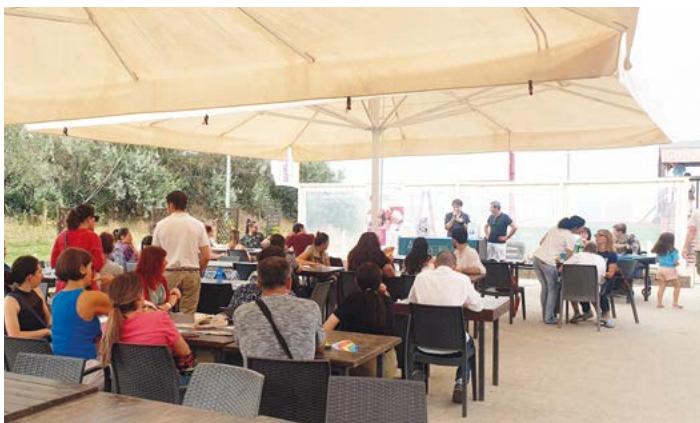
La prima tappa estiva dell'evento dedicato ai giovani Soci e Socie al Bagno Marinamore di Marina di Ravenna

Il coordinamento riparte con le attività estive dedicate ai Soci e alle Socie under 35