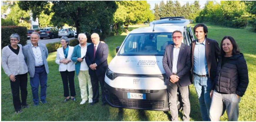
Inaugurazione del nuovo mezzo per trasporto disabili della Fondazione Don Pippo

dazione Don Pippo di Forlì ha acquistato grazie al contributo della BCC e alla campagna