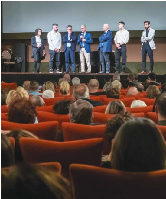
Le autorità sul palco del cinema Sarti di Faenza alla proiezione del docufilm 'Ho visto il finimondo - Il racconto dell'alluvione'

In tantissimi alla proiezione del docufilm dedicato all'alluvione in Romagna del 2023