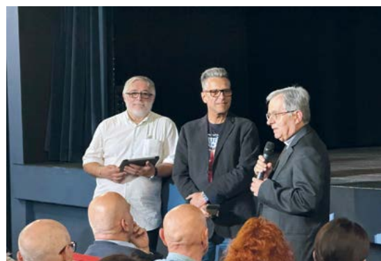
La prima del film al cineteatro Victor di Cesena