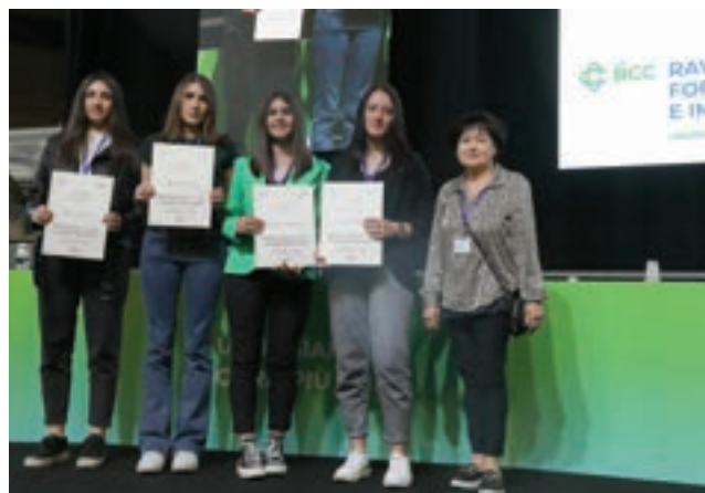
La premiazione del Premio per la Scuola dei ragazzi dell'Istituto Oriani di Faenza