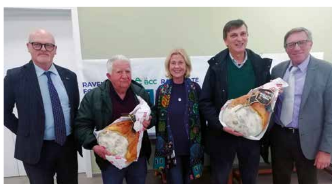
Premiazione della coppia vincitrice

Dopo la sospensione per pandemia, è ripreso dall'anno scorso lo storico Torneo di Marafone e Briscola, che ha raggiunto la ventesima edizione. Organizzato dal Comitato locale di Forlì presso la Parrocchia di "San Marco in Varano", il Torneo si è svolto venerdì 8 e 15 novembre (eliminazione), venerdì 22 (semifinale), per concludersi venerdì