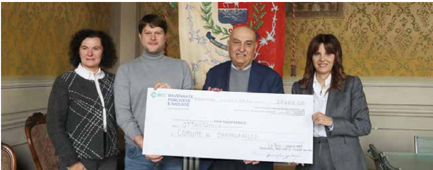
Consegna del contributo da parte della BCC ravennate, forlivese e imolese a favore delle popolazioni colpite dall'alluvione nel territorio di Bagnacavallo