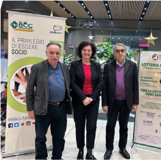
La premiazione a Lugo