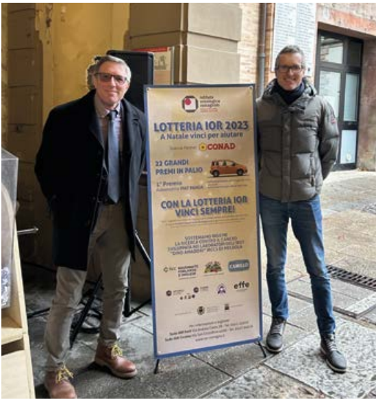
La premiazione a Forlì