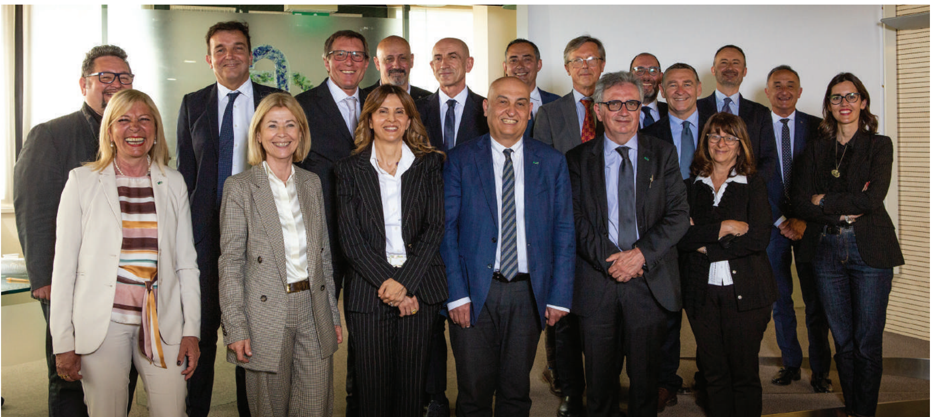
Il Consiglio di Amministrazione, il Collegio Sindacale e la Direzione della BCC