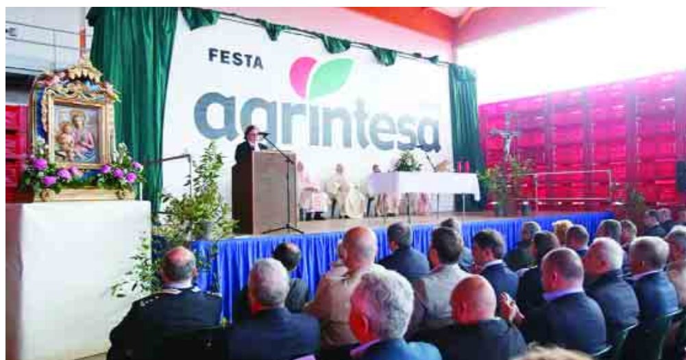
Sopra e sotto due immagini della Festa della Cooperazione di Bagnacavallo dello scorso anno.

Per quanto riguarda il programma, come ogni anno il momento cruciale delle 5 giornate sarà il primo maggio con la S. Messa celebrata da mons. Vasco Graziani seguita poi dal pranzo della cooperazione al quale partecipano solitamente circa 500 persone. Quest'anno vi saranno inoltre nuovi momenti ricreativi come l'esibizione degli sbandieratori del Rione Nero di Faenza e diversi momenti musicali dedicati in particolar modo al boogie woogie e al rock & roll in ricordo del cooperatore Gualtiero Boschi, scomparso lo scorso