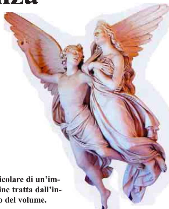
Particolare di un'immagine tratta dall'interno del volume.

Zanzi descrive con le sue immagini molti dei contenuti monumentali del cimitero faentino, in funzione dal 15 marzo 1816 in seguito al famoso Editto di Saint-Cloud del 1804 che imponeva le sepolture al di fuori delle città per motivi igienici. Contenuti monumentali che tutti noi incrociamo con lo sguardo quando ci rechiamo per far visita ai nostri defunti, ma che non conosciamo mai a fondo veramente. L'autore ce li presenta, come lui stesso ammette nella prefazione del libro, con il proposito di "rileggere le bellezze dell'Osservanza, non dal punto di vista storico e artistico come già fatto dal Bettoli [l'autore fa riferimento all'opera di Giacomo Bettoli, L'Osservanza di Faenza - Storia e piccola guida, Tipografia Faentina, 1990] ma come le può intravedere un fotografo che non si limita a riprodurre la realtà ma che si sente libero di interpretarla seguendo la propria fantasia."