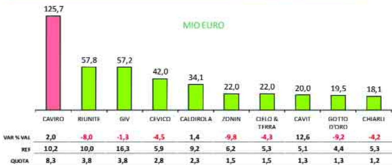
Classifica dei produttori di vino nella Grande distribuzione italiana. Caviro leader con l'8,3% della quota.

grazie ai marchi Cirio, Valfrutta e Yoga