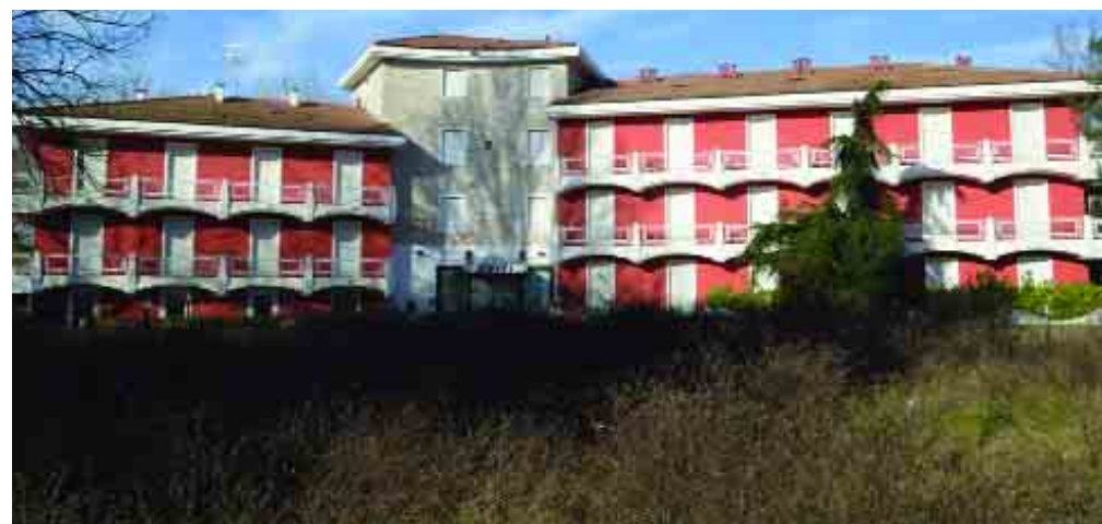
A sinistra "La diva blu" di Giovanni Boldini. Sopra un edificio confiscato alla mafia fotografato per Libera in occasione dell'esposizione bolognese.