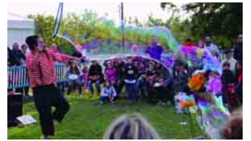
www.sagracampagna.it, su Facebook pagina "Sagra della Campagna Pieve Cesato", tel 338 2333669.