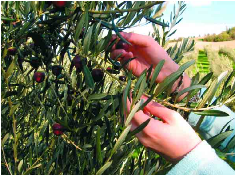
L'olio extravergine di oliva del territorio imolese ha ottenuto recentemente l'autorizzazione all'utilizzo del marchio QC (qualità controllata della regione Emilia Romagna). E' possibile acquistarlo presso le Macellerie del Contadino della Clai.