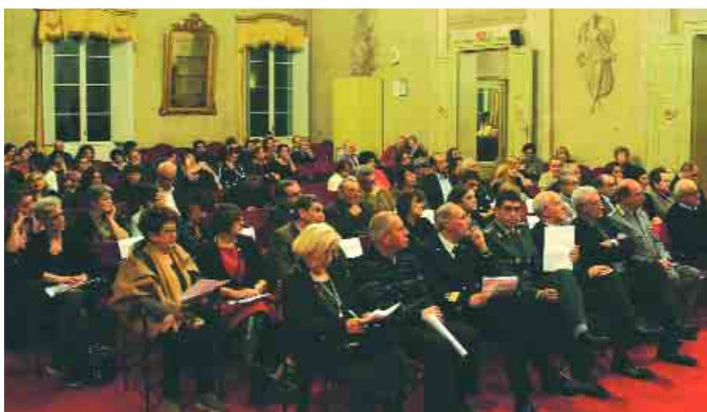
Ravenna, 3 dicembre: un momento delle premiazioni del concorso “Il giusto più del dovuto” nel ridotto del teatro Alighieri.

La cooperativa ravennate all'avanguardia nel campo dell'innovazione e della sostenibilità ambientale