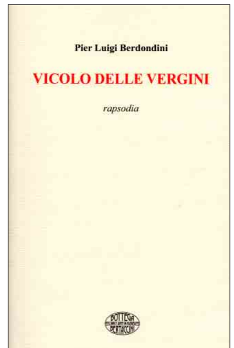
Pier Luigi Berdondini. Vicolo delle Vergini. Rapsodia. Faenza, Bottega Bertaccini- Homeless Book, 2014.

La Bottega Bertaccini e la cooperativa Homeless Book di Faenza, in ricordo di Leotta, si sono fatte oggi carico dell'edizione dando vita ad un elegante volume, tirato in 250 copie numerate, che segna l'inizio della collaborazione fra un editore, finora quasi esclusivamente specializzato nella produzione di e-book, ed una attività commerciale specializzata in libri d'arte e di antiquariato.