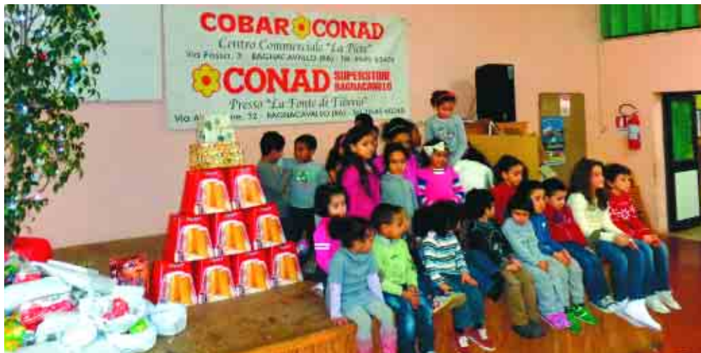
Bagnacavallo: tre immagini del pranzo di Natale, organizzato con il contributo delle cooperative del territorio.

Una rappresentazione storica che si sviluppa su 70 mq ed è composta da oltre 40 gruppi di figure. Visitabile fino al 1° febbraio