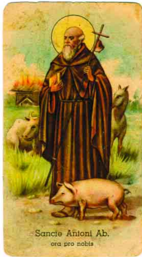
Sancie Antoni Ab. ora pro nobis