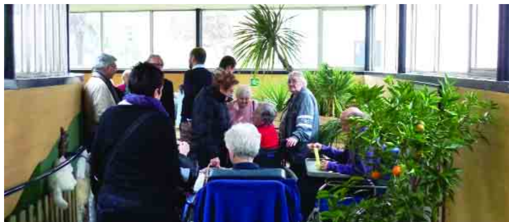
Fusignano, 20 dicembre: due momenti relativi all'inaugurazione del Giardino d'Inverno presso la Casa per anziani San Rocco.

Due esempi delle iniziative organizzate in occasione delle festività dalle cooperative sociali del Solco che gestiscono centri per anziani