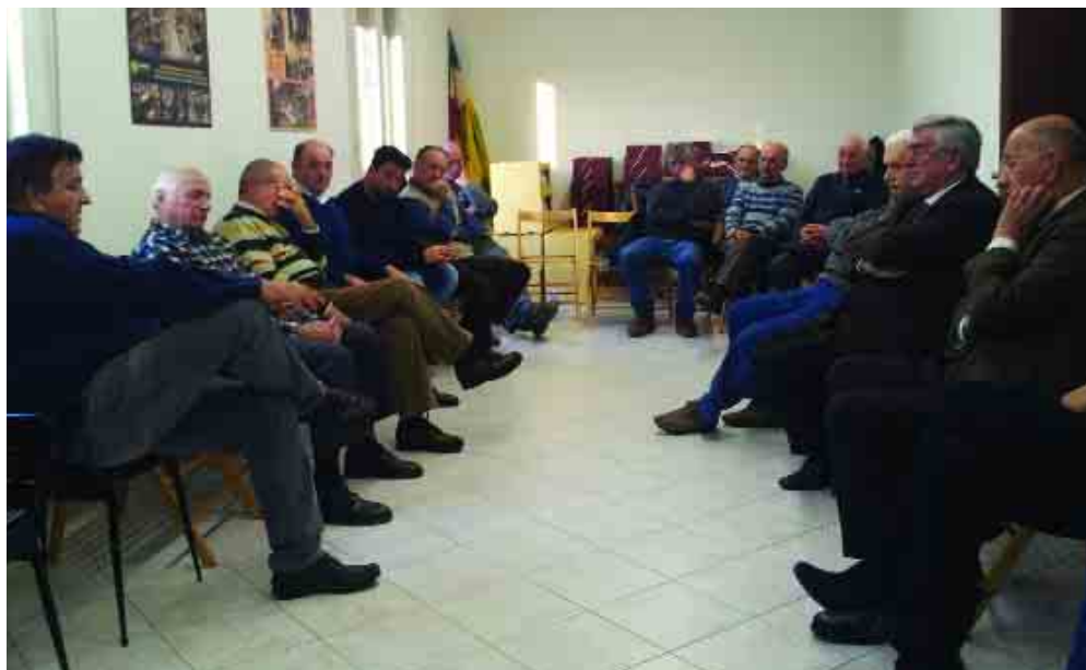
Conselice, 20 dicembre: la tradizionale riunione dei consigli di amministrazione del gruppo di Punta Frattina.

Il 24 gennaio si terrà l'assemblea generale dei soci per l'approvazione dei risultati per l'annata 2013/2014