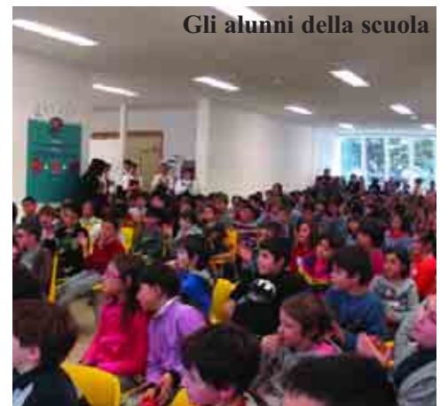
Gli alunni della scuola

Progetto Aroma concentra la sua attività sullo sviluppo di applicazioni per usufruire di internet tramite smartphone e tablet