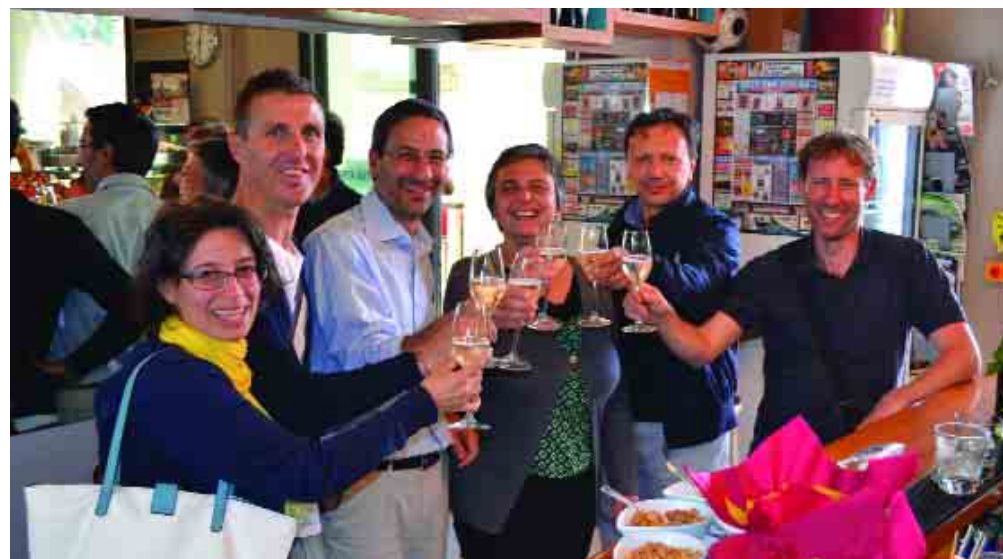
Ravenna: il gruppo dei soci della cooperativa Kirecò brinda al progetto che prevede la nascita di un centro di innovazione sociale, formazione e creatività.

l'acqua e dei rifiuti e durante i prossimi anni scolastici si susseguiranno progetti nelle scuole, laboratori all'interno del centro e nel parco. F.L.