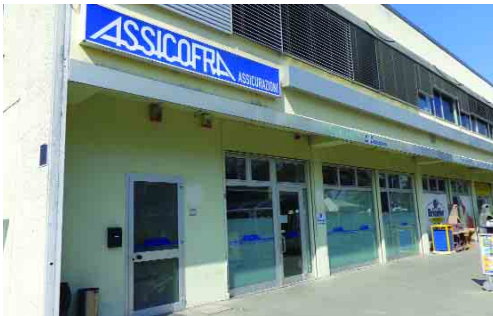
Gli uffici di Assicofra a Faenza, in via Volta 11.

Se sei un professionista già formato nel ramo assicurazioni e sei interessato ad inserirti in una struttura ben avviata contatta Assicofra allo 0546 621641 o invia il tuo curriculum a info@assicofra.it