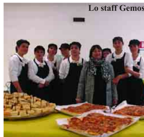
Lo staff Gemos