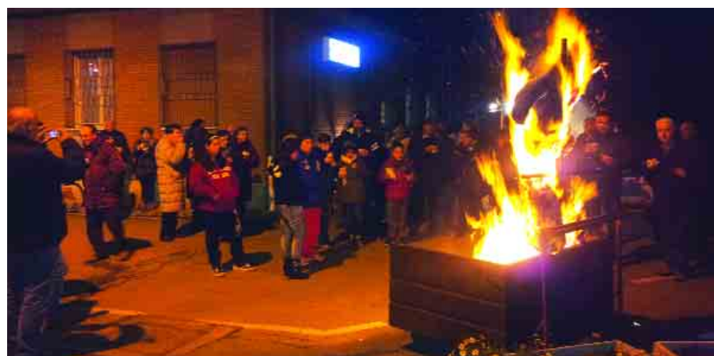
Conselice, 20 dicembre: il vecchio brucia, secondo tradizione.