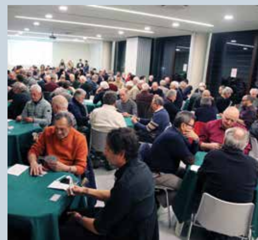
In alto due iniziative per i Soci delle scorse edizioni. Sotto l'invito per il Torneo di Burraco