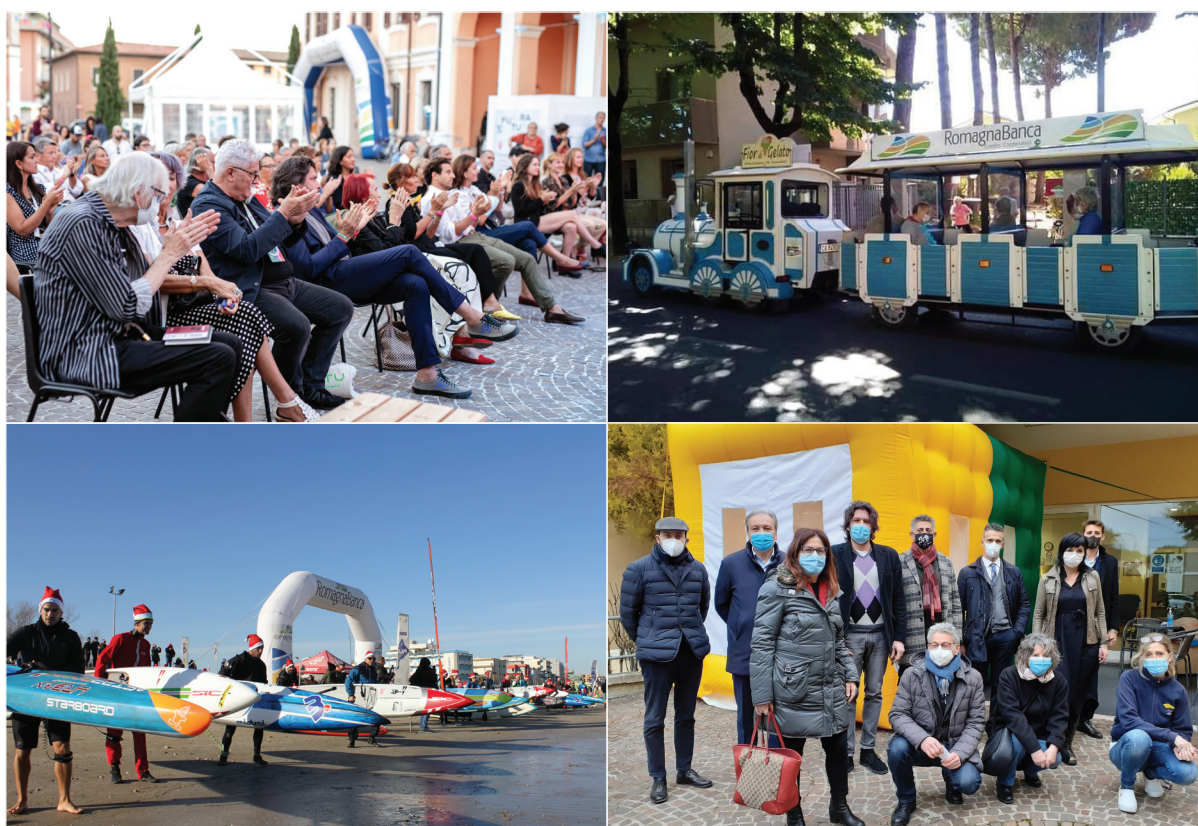
Alcune immagini di eventi e iniziative di solidarietà realizzati nel 2021 grazie al supporto di RomagnaBanca: il Festival della Fotografia SI Fest, il trasporto anziani della Cra di Cesenatico, la Scuola di Sup di Bellaria Igea Marina, la Stanza degli abbracci della Cra di Savignano