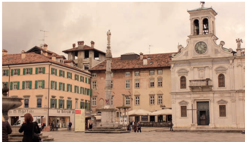
In alto e a sinistra due immagini di Trieste, a destra Udine