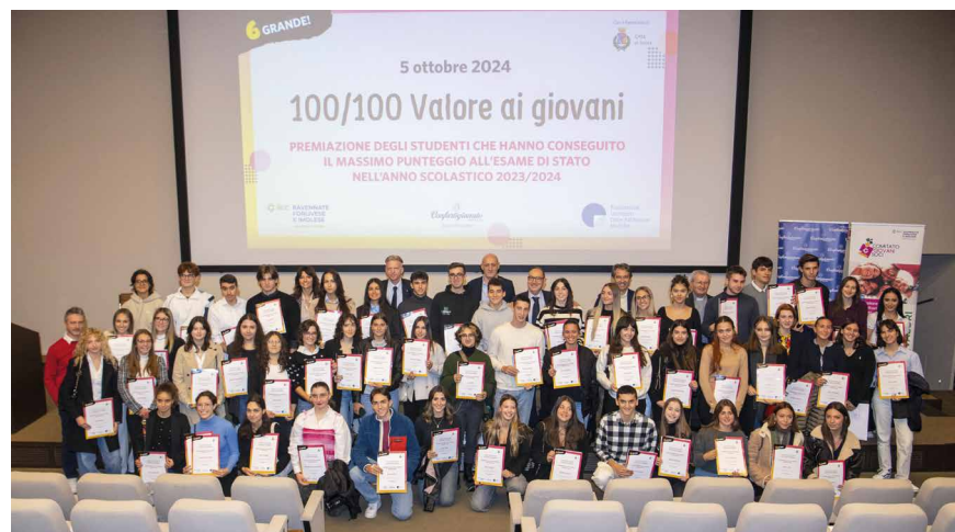
Premiazione dell’iniziativa “100/100 - Diamo valore ai giovani” a Imola