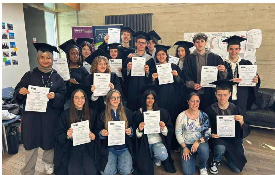
Graduation degli studenti in Erasmus in Irlanda

Nella settimana dedicata agli Erasmus days nel mese di ottobre, il Centro Educazione all’Europa di Ravenna e la Fondazione Giovanni Dalle Fabbriche - Multifor ETS di Faenza hanno tracciato il bilancio sull’iniziativa di mobilità formativa Erasmus plus “FORMANDO GIOVANI IN