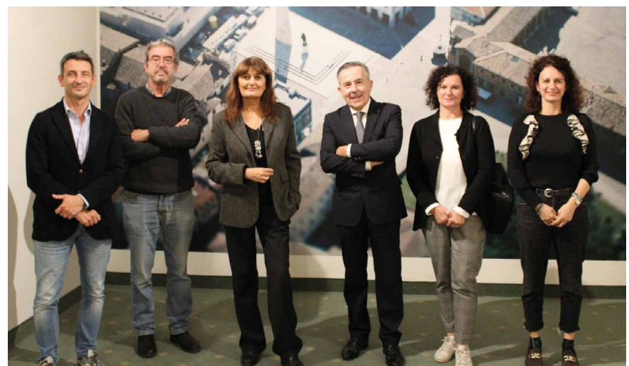
I relatori della conferenza stampa di presentazione della rassegna 2024-2025 del Caffè Letterario di Lugo