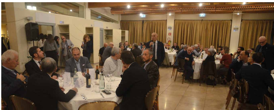
Cena dell'Area territoriale di Forlì di mercoledì 9 ottobre