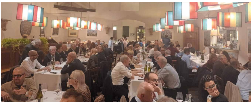
Cena dell'Area territoriale di Faenza di giovedì 17 ottobre