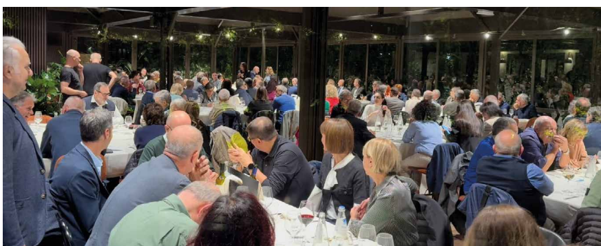
Cena dell'Area Territoriale di Romagna Centro di mercoledì 23 ottobre