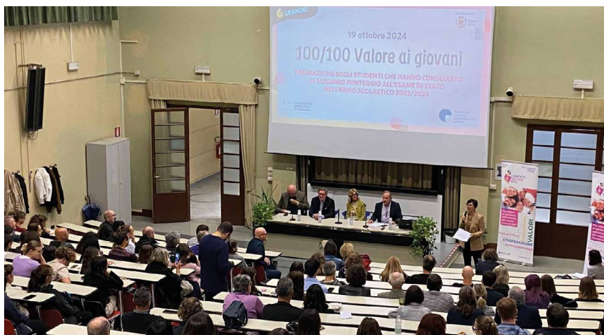
Premiazione dell’iniziativa “100/100 - Diamo valore ai giovani” a Forlì

Tutti i ragazzi sono stati premiati con una borsa di studio del valore di 100 euro, che raddoppia a 200 euro se Soci o figli di Soci della Banca.