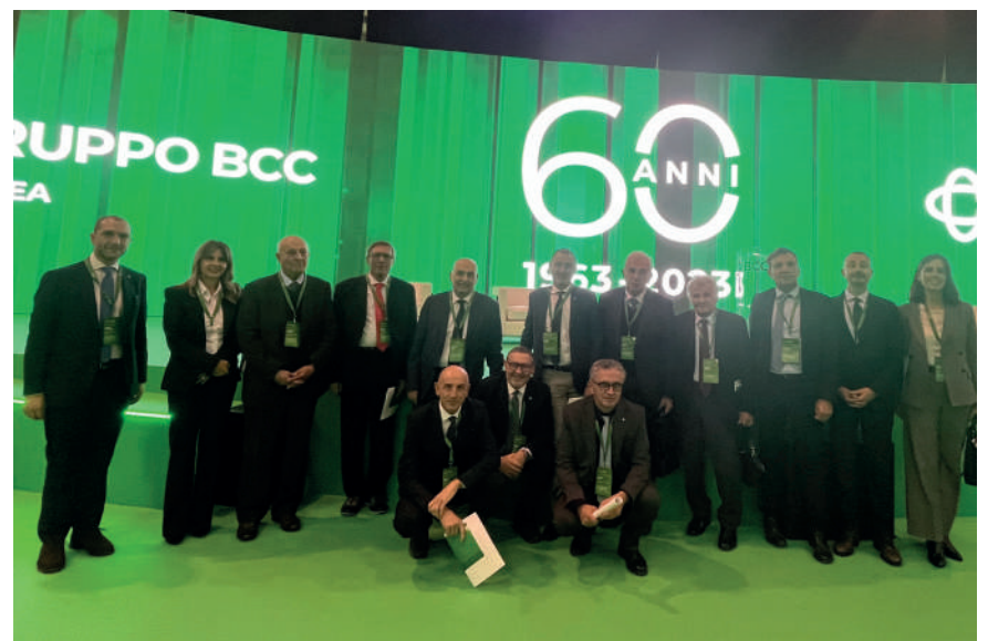
Amministratori e Dirigenti della BCC presenti al convegno

Al 30 settembre 2023, il Gruppo BCC Iccrea ha raggiunto un attivo totale pari a 171,5 miliardi, un CET1 del 20,8% e un TC ratio del 21,9% largamente al di sopra dei requisiti, un NPL ratio lordo del 4,1%, un NPL ratio netto dell'1,2%, un livello di copertura dei crediti deteriorati pari al 70,6%, un indicatore di liquidità LCR sopra al 250%, con un patrimonio netto consolidato pari a 13,3 miliardi di euro e fondi propri per 13,8 miliardi.